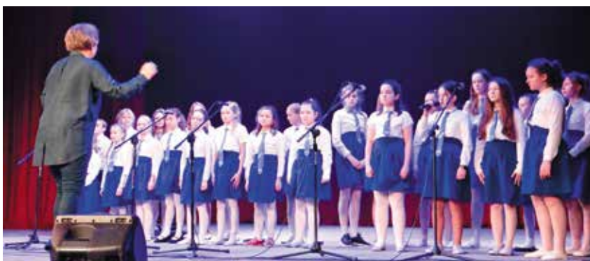
Zespół wokalny „Trema” zdobył II miejsce podczas Przeglądu Dziecięcych i Młodzieżowych Zespołów Artystycznych Śląska Cieszyńskiego.

To jeden z najtrafniejszych komentarzy, które pojawiły się po zamieszczeniu fotorelacji z ostatnich działań naszej szkoły. Przyczynił się on bezpośrednio do tego, że na łamach naszego lokalnego czasopisma dzielimy się tym, co ostatnio dzieje się w Szkole Podstawowej im. "Trzech Braci" w Hażlachu