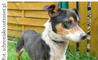
Lorek to pies znaleziony 2,5 roku temu w Hażlachu.

W związku z realizacją Gminnego Programu Opieki nad Zwierzętami