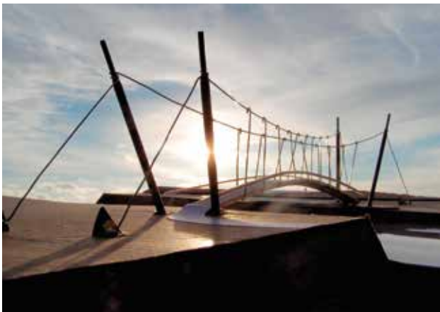
Projektowana nowa kładka nad rzeką Olzą.

1 marca 2018 r. w Cieszynie odbyło się czwarte posiedzenie Euroregionalnego Komitetu Sterującego dla Funduszu Mikroprojektów Programu Interreg V-A Republika Czeska – Polska w Euroregionie Śląsk Cieszyński. Spośród 32 wniosków złożonych do rozpatrzenia na to posiedzenie Komitetu, dofinansowanie ze środków Europejskiego Funduszu Rozwoju Regionalnego w ramach osi priorytetowej 2 uzyskało sześć projektów , zaś w ramach osi priorytetowej 4 – dwadzieścia dwa projekty (w tym 13 na liście rezerwowej). Wśród wniosków, które otrzymały dofinansowanie znajdują się dwa projekty z Gminy Hażlach.