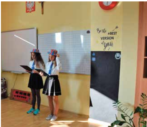
Uroczystość uświetniły występy uczniów i tort.

Uroczystość uświetniły występy uczniów, prezentacja multimedialna i specjalnie upieczony na tę okazję tort. Słodki bufet przygotowany przez rodziców, a obsługiwany przez Radę Rodziców i uczniów cieszył się wielkim powodzeniem.